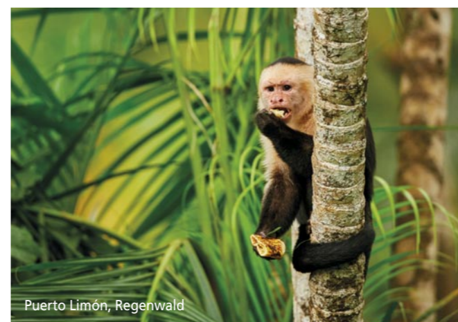
Puerto Limón, Regenwald

ART409: 29.10. – 18.12.2026 (50 Tage) ART409: 29.10. – 23.11.2026 (25 Tage) inkl. Rückflug ART410: 23.11. – 18.12.2026 (25 Tage) inkl. Hinflug