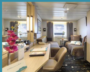
2-Bett außen, Neptun-/Saturn-/Orion-/Apollo-Deck (Kat. I, J, K, M, O, J1, L)