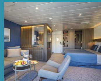
2-Bett-Suite, Balkon, Lido-Deck (Kat. V)