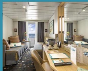
2-Bett-Superior, Balkon, Orion-/Apollo-/Jupiter-Deck (Kat. PG, P, Q, R, Q1)