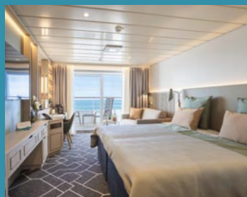
2-Bett-Junior-Suite, Balkon, Jupiter-/Lido-Deck (Kat. S, T)