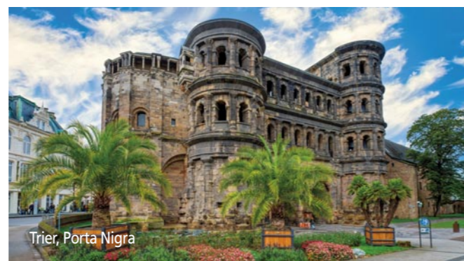
Trier, Porta Nigra

Leinen los zu einer ganz besonderen Flussreise entlang Deutschlands berühmter Weinflüsse Rhein und Mosel. Diese Reise führt Sie durch das romantische Rheintal auf einer faszinierenden Strecke mit herrlichen Aussichten auf Burgen und Schlösser. Vorbei am Deutschen Eck nimmt MS Anesha Kurs auf die Mosel und Sie setzen Ihre Reise auf dem verschlungenen Flusslauf im Moseltal fort. Verträumte Ufer und hübsche Städtchen wie Cochem und Bernkastel-Kues laden zum Verweilen ein. Höhepunkt einer Moselreise ist Trier mit historischen Baudenkmalern wie z.B. der Porta Nigra. Ein interessanter Ausflug führt Sie in das benachbarte Großherzogtum Luxemburg. Genießen Sie einzigartige Ausblicke und einen Hauch Mittelalter ganz entspannt von Bord der Anesha bevor Ihre Reise über Mosel und Rhein in Köln zu Ende geht.