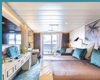
2-Bett-Junior-Suite, Balkon, Panorama-Deck (Kat. T)