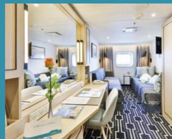
2-Bett außen, Saturn-Deck (Kat. K, L), Orion-Deck (Kat. M)